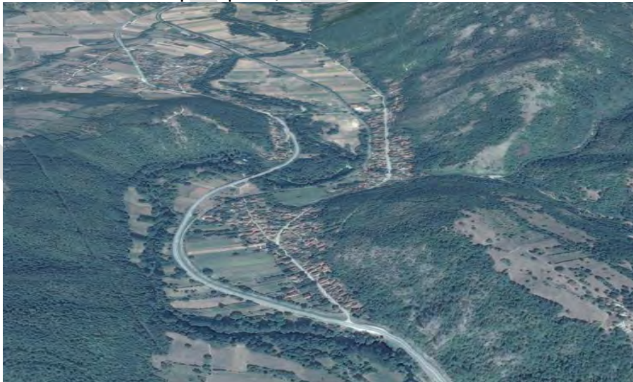
Слика 7. ОШ у насељу Вратарница.