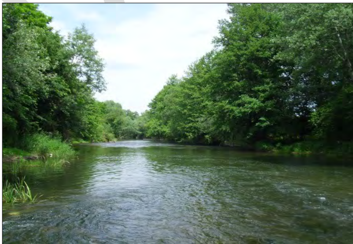
Слика 14. Слив Великог Тимока