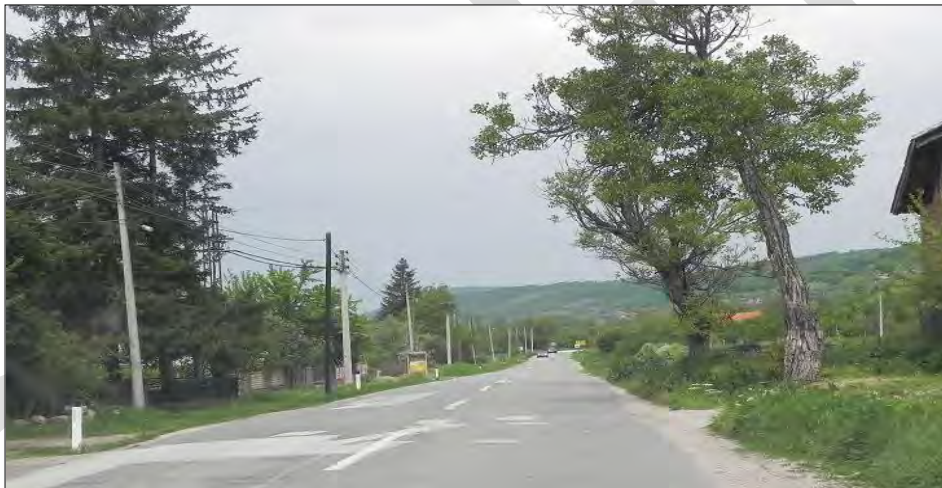
Слика 8. Насеље Мали Извор.

Варошица Минишево се налази уз пут Зајечар – Књажевац, на десној обали реке Клисуре. Варошица је врло збијеног типа. Подељена је друмом у два дела – источни (већи) и западни (мањи). У насељу живи 779 становника и има 257 домаћинстава спратности П до П+2. У непосредној близини пута налази се осморазредна ОШ, дом културе, црква и амбуланта (слика 9, 10 и 11),