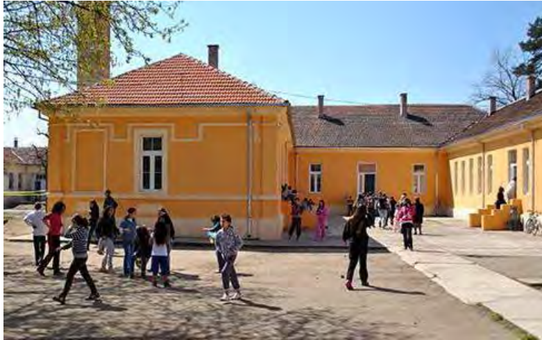
Слика 10. Дом културе Минишево.