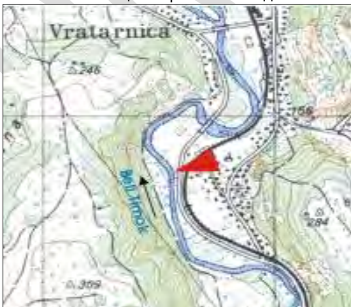
Слика 15. Станица површинских вода: ВРАТАРНИЦА

На основу података Агенције за заштиту животне средине из 2013. године, мерна станица Вратарница (слика 15), река Бели Тимок припада Класи III, што значи да на основу граничних вредности елемената квалитета обезбеђује услове за живот и заштиту риба и може се користити за снабдевање водом за пиће уз претходни третман коагулацијом, флокулацијом, филтрацијом и дезинфекцијом, купање и рекреацију, наводњавање и индустријску употребу. Због природе радова на рехабилитацији пута, уз примену добре грађевинске праксе, водотокови неће бити под негативним утицајем.