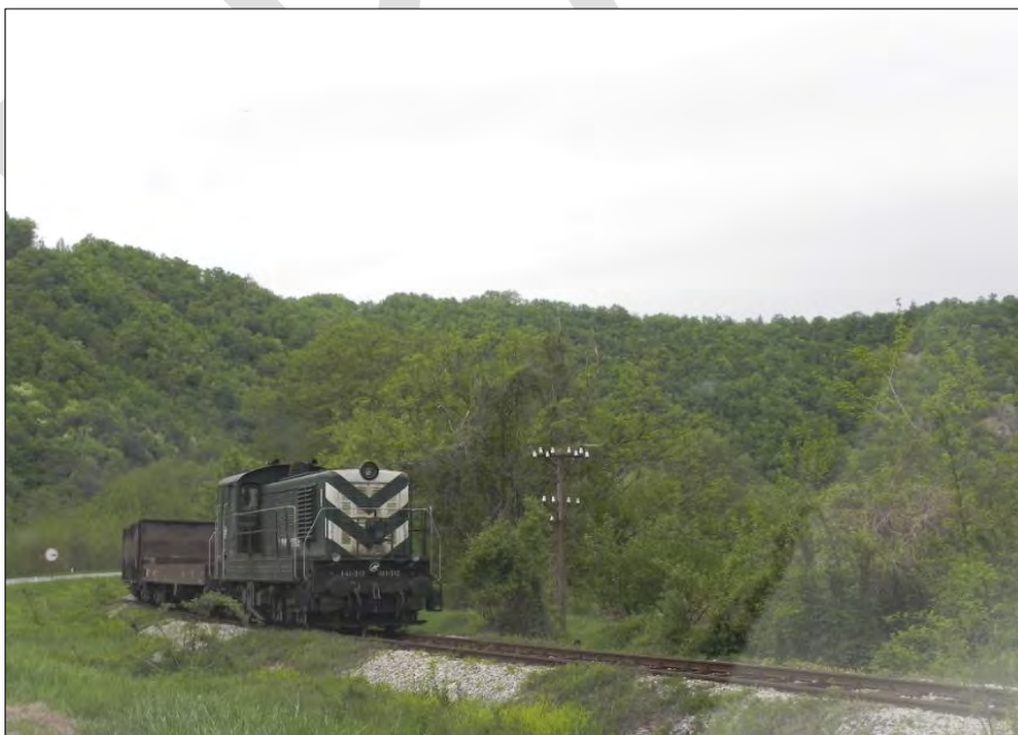
Слика 3. Једноколосечна железничка пруга.

Пруга није електрифицирана и представља извор загађујућих материја у атмосферу. По важећем реду вожње саобраћа 5 парова локалних путничких возова за превоз путника у унутрашњем саобраћају и 5 парова теретних