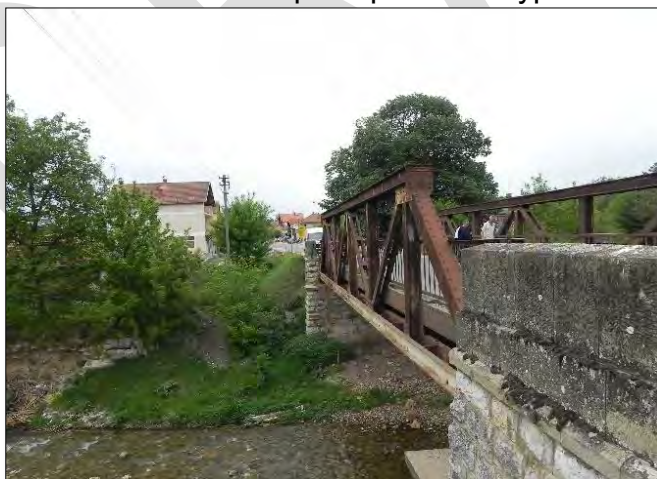
Слика 14. Мост преко Сиње реке.