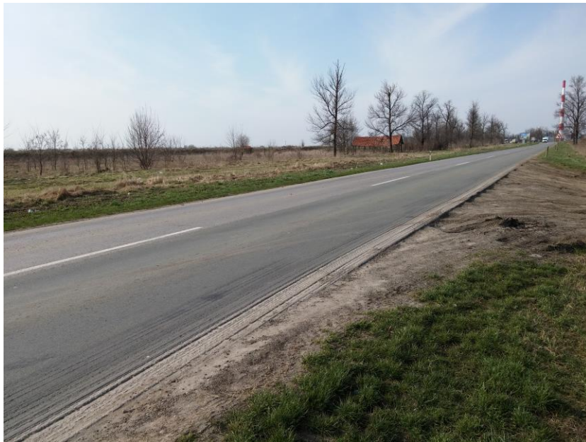
- државни пут ІБ реда бр. 13 на месту укрштања са обилазницом (поглед према Зрењанину) -

Предмет пројекта је изградња кружне раскрснице, на месту укрштања будуће обилазнице око Зрењанина и државног пута ІБ реда бр. 13 који повезује Зрењанин и Београд, на км 127+321.00. Раскрсница се налази на улазу у град Зрењанин, у зони која је намењена за израду индустријских комплекса, тако да су елементи ситуационог плана и попречног профила прилагођени тако да се омогући несметан пролаз меродавног тешког теретног возила са приколицом.