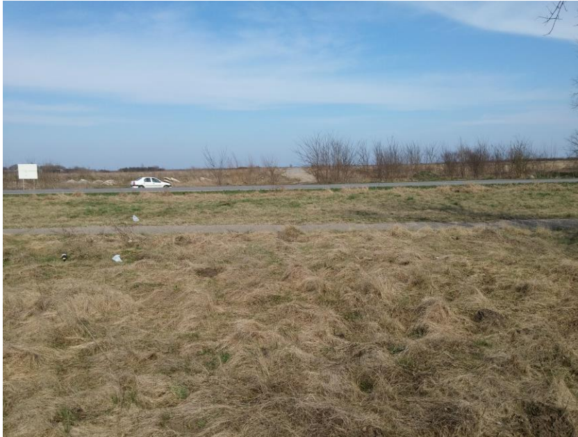
- место укрштања државног пута и обилазнице око Зрењанина -