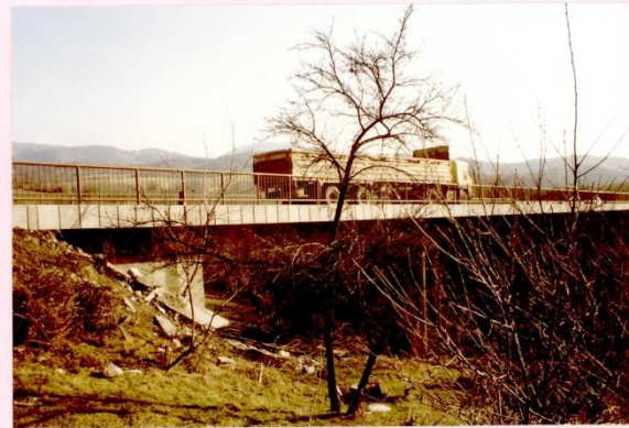
Изљег са сйране