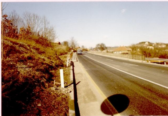
Пољег према Београду