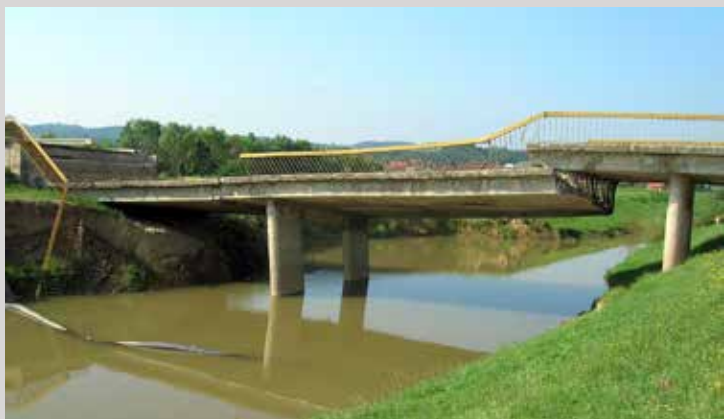
Стари мост (Поглед на мост са низводне стране)

Поред тога, урађена је и регулација реке Тамнаве на делу моста, као и пре и после моста, у укупној дужини од 411 m. Извршено је и уклапање пута уз подизање нивелете пута за око 70 cm.