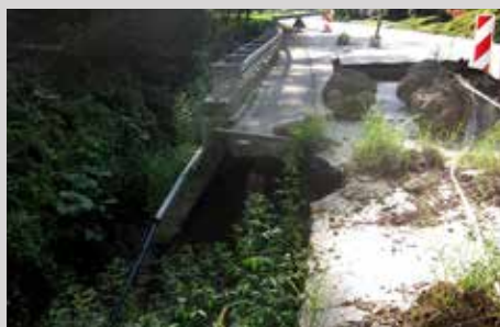
Изглед дела пута пре интервенције

безбедно одвијање саобраћаја. Приступили смо извођењу радова и исти су завршени у рекордном року, стручно и квалитетно, за непуних месец дана и деоница је пуштена у саобраћај.