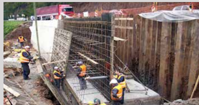
1. Пре почетка радова