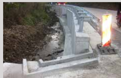
Изглед дела пута након интервенције